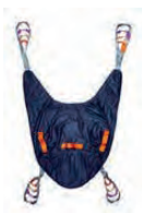
1170AC ARNÉS UNIVERSAL