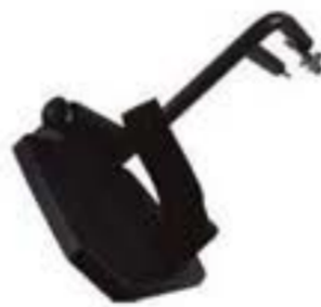
1YK712-02-U REPOSAPIÉS DERECHO