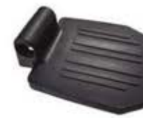
1YK715-08-U PLATAFORMA REPOSAPIÉS