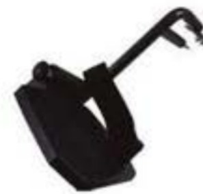
1YK713-02-U REPOSAPIÉS IZQUIERDO