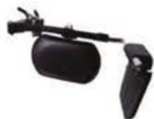
1AYJ00509-92-I REPOSAPIÉS ELEVABLE IZQUIERDO