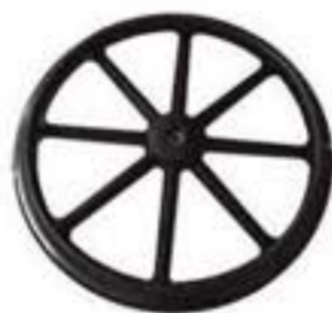
1YK709-08-U RUEDA TRASERA 24"