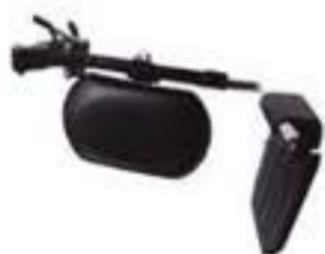
1AYJ00509-92-D REPOSAPIÉS ELEVABLE DERECHO