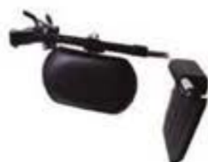
1YK762L-08-U REPOSAPIÉS ELEVABLE DERECHO