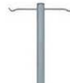
1FS512-25-U PORTASUEROS 2 GANCHOS