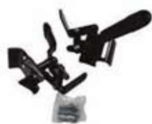
1YK708-08-U JUEGO DE FRENOS