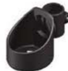
1M31000326-02-U PORTABASTÓN MÁS CINCHA UNIVERSAL