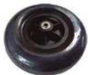
1YK716-08-U RUEDA DELANTERA