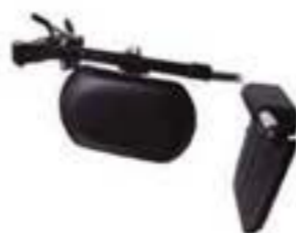
1YK762R-08-U REPOSAPIÉS ELEVABLE IZQUIERDO