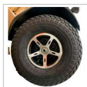
Ruedas PU macizo con dibujo