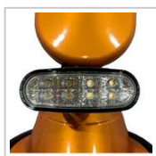
Luz led delantera