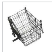
1M417000SC-08-U CESTA PORTA OBJETOS