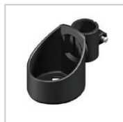
1M31000326-02-U PORTABASTÓN MÁS CINCHA UNIVERSAL