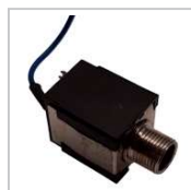
1M61090046-08-U CONECTOR LLAVE MANDO