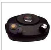
1M30500090-08-U FRONTAL COMPLETO