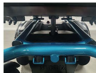
Eje delantero pivotante